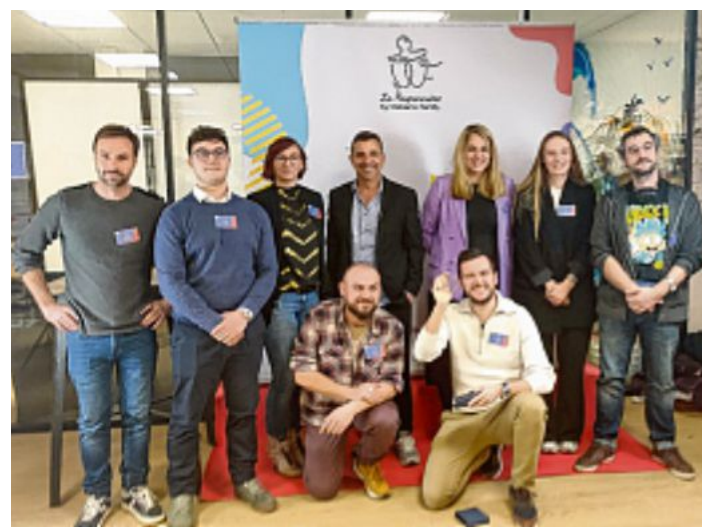
Les huit finalistes étaient présents pour parler de leurs projets.

En récompense de ce succès, la jeune entrepreneuse va recevoir un soutien important en devenant le premier "poupon" de Welcome Family. Elle bénéficiera premièrement d'une avance de 50 000€ pour financer la production du jeu. Elle aura également accès aux locaux de l'en-