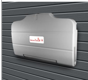
Table à langer